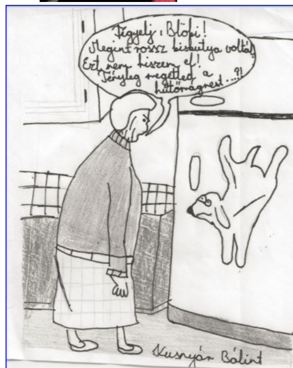
Kusnyár Bálint 6.g