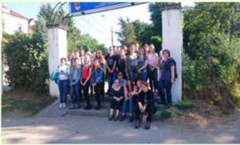
Fogalmazást készítette: Bacsik Ágnes

Az első napunk igazán kellemesen indult, a kora reggeli napsütés mindenkit feldobott és nagy örömmel vágtunk neki a hosszú útnak. Először Nagyváradon álltunk meg. A busz leparkolt, mi pedig nekivágtunk felfedezni a várost gyalog. A püspöki palota kertjében készültek el a kirándulásunk első fotói. A városnézés után elindultunk, hogy megnézzük a híres Királyhágót. Megérkeztünk Nagyenyedre. A kollégium előtt parkolt le a buszunk, ahol a nagyenyedi diáktársaink már vártak ránk. Egy csodás és egyben fárasztó nap után hamar elmentünk aludni és alig vártuk, hogy a következő nap milyen meglepetéseket tartogat számunkra.