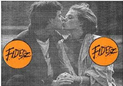
Választási plakát 1990