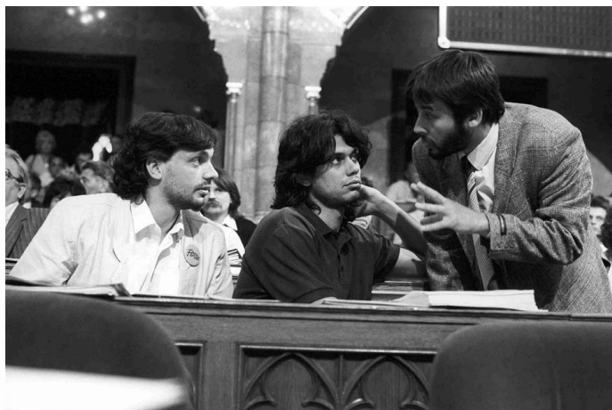
Orbán Viktor, Deutsch Tamás, Áder János 1990